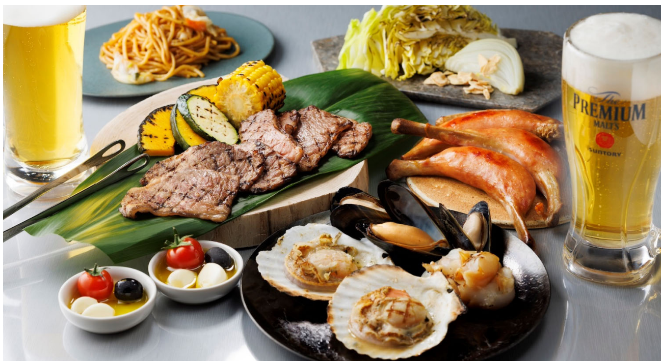
<『The GARDEN BBQ 2024』開催イメージ>

ホテル日航成田(千葉県成田市:総支配人 山田 篤)では、毎年恒例の夏季限定ガーデンバーベキュー『The GARDEN BBQ 2024』を2024年7月6日(土)～8月25日(日)の期間に開催します。