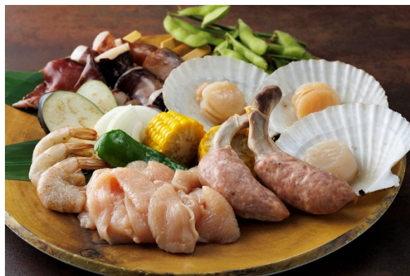
<食べ放題メニュー>