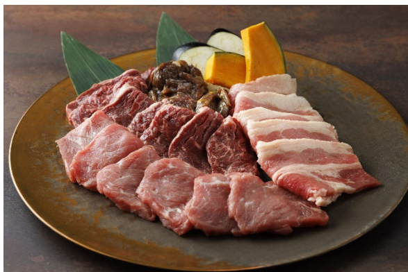
<ファーストミートプレート>