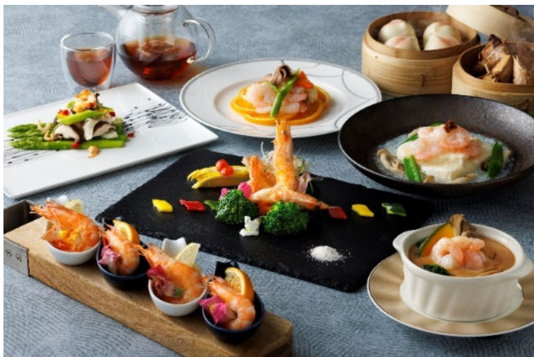
＜中国料理「桃李」:満腹ランチオーダーバイキング(海老フェア)～7種類の中国茶とともに～＞