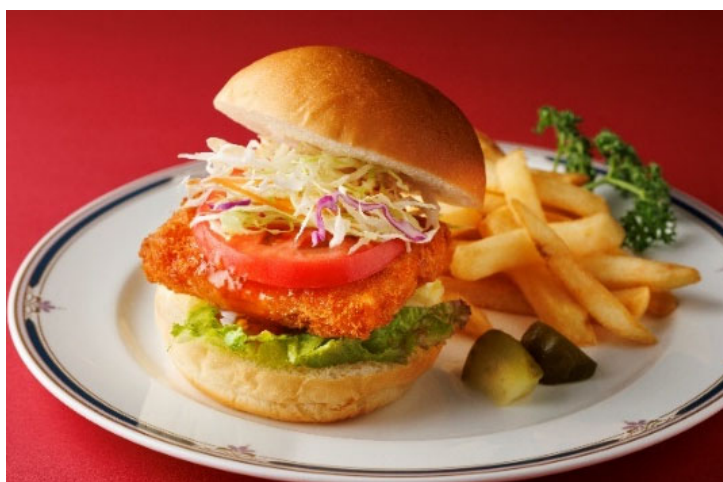
＜コーヒーラウンジ:海老カツバーガー＞