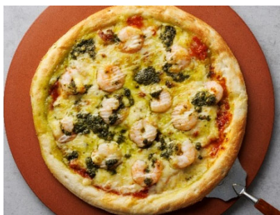
〈海老のジェノベーゼピザ〉