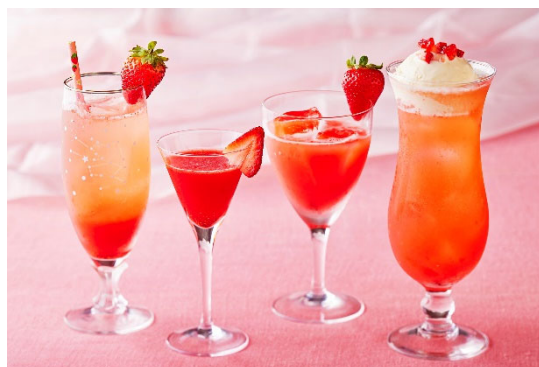
<『ストロベリーカクテルフェア』/開催イメージ>

Princess ¥2,000 (One Harmony会員料金 ¥1,600)