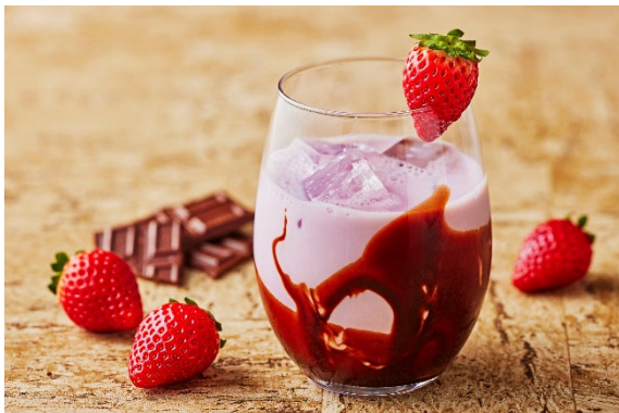
<『いちごチョコミルク』/イメージ>

いちごミルクとチョコレートソースを合わせた、お子様か ら大人の方まで楽しめるドリンクです。