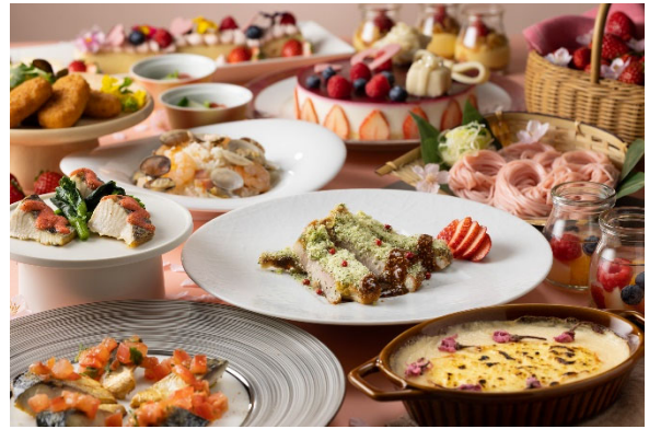
<3月バイキング『いちご×さくら』/イメージ>

<デザート>桜のスフレチーズケーキ／ナポレオンパイ／いち ごのギモーヴ／フルーツゼリー