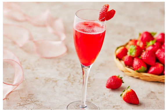
<『いちごベリーニ』/イメージ>

いちごピューレとスパークリングワインをペアリング し、すっきりとした味わいに仕上げたカクテルです。