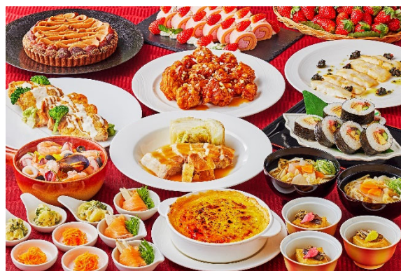
<2月バイキング『いちご×ショコラ』/イメージ>

<デザート>チョコレートファウンテン/いちごのショートケーキ/紅茶とショコラのムース/いちごのロールケーキ/マロンショコラタルト