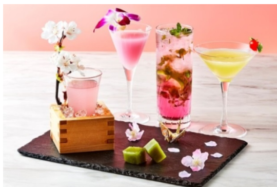
左から「プレートでお花見」、「さくらの便り」、 「さくらモヒート」、「シンデレラストーリー」

※One Harmony は、オークラ ホテルズ & リゾート、ニッコー・ホテルズ・インターナショナル、ホテルJAL シティでご利用いただける会員プログラムです。ホテルをご利用のたびにポイントがたまるほか、多彩な特典をご用意しております。