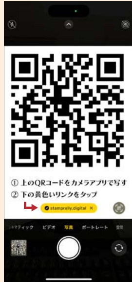
① 上のQRコードをスマートフォンで読み取る