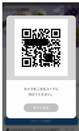
① 館内にかくれたチーバくんを見つけて、側にあるQRコードを読み取る

館内でかくれんぼしているチーバくんは20カ所！ 1階・2階(本館のみ)・11階のどこかに隠れているよ！（レストランやバーの店内、宴会棟、別館2階、客室階にはいません）