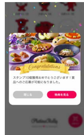
③ どんどんスタンプを貯めて欲しい賞品に応募しよう！