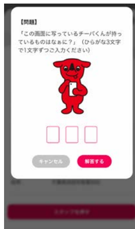
② スマートフォン上に表示される問題に答えて、正解したらスタンプ獲得！