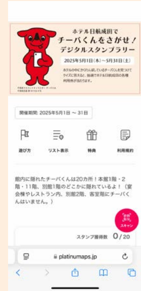
③ 登録完了！チーバくんをさがしにいこう！