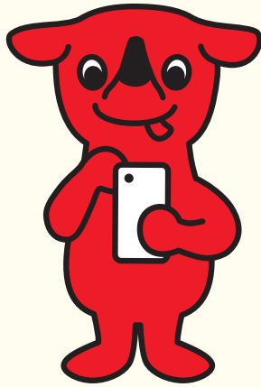
千葉県マスコットキャラクター「チーバくん」 千葉県許諾 第A1152-4号