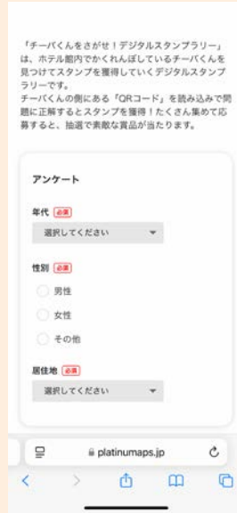
② 簡単なアンケートに答えたら