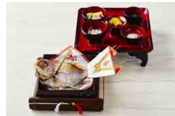
【お食い初めセット】 ¥3,630

真鯛の昆布メカルパッチョ仕立て 豚肉と彩り野菜の塩麴炒め 海老と白身魚のスイートチリソース 帆立貝のバター醤油焼き 大葉の香り 牛サーロインの炙り焼き 柚子マスタードソース 鮪と赤海老の祝いちらし寿司 蛤入り茶碗蒸し 潮仕立て 季節のデザート&フルーツ コーヒーまたは紅茶