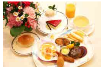
お子様料理 【すこやかコース】 ¥3,000