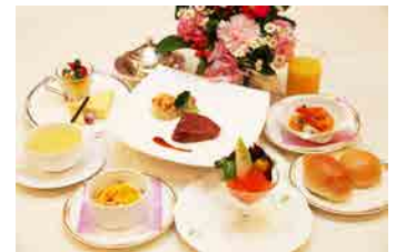
お子様料理 【かがやきコース】 ¥5,000